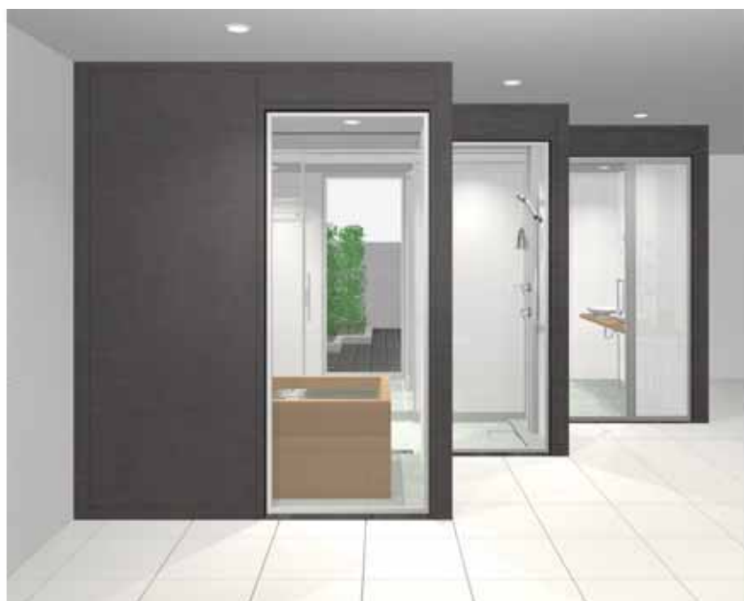
「フリースタイルサニタリー」