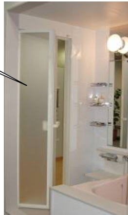
折戸搭載ユニットバス